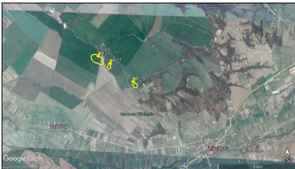
Fig. 3. Situri din perioada secolelor II–IV dHr.

Ultimul sit arheologic a fost descoperit cu ocazia unei investigații finanțate de Romtelecom, ceramica din cadrul acestuia fiind neolitică și medievală 7 .