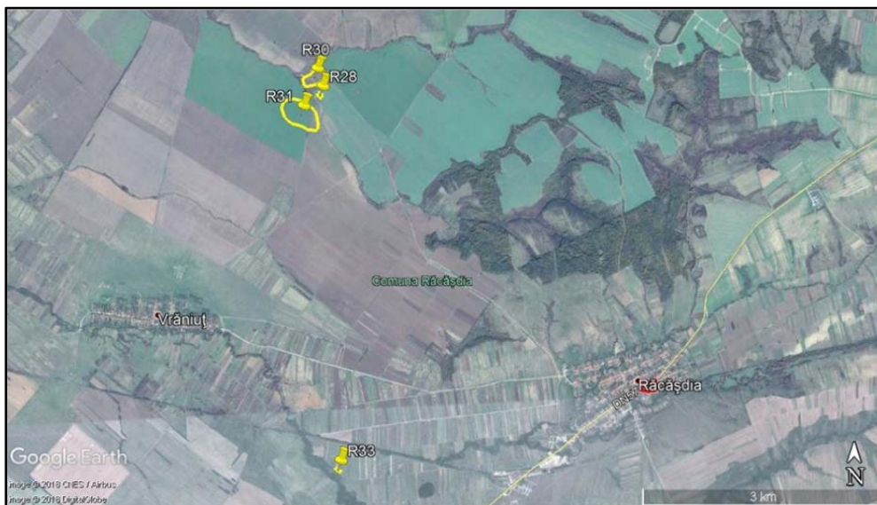
Fig. 5. Situri medievale timpurii.

Primele trei așezări sunt situate în cadrul terasei pârâului Mercina, iar situl R33 este amplasat în cadrul terasei pârâului Vrani, distanța față de cursul de apă cel mai apropiat pentru siturile enumerate mai sus fiind de circa 50–100 de metri. Suprafața pe care sunt situate este plană ( Fig. 5 ).