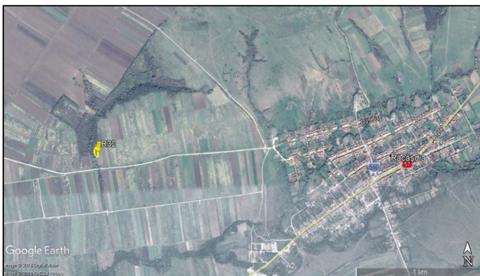
Fig. 7. Situri din epoca modernă.

Materiale din perioada romană nu au fost identificate, spre exemplu ceramica de tip terra sigillata sau țigle, monede ori inscripții, deși în monografia localității, scrisă de Emilian NOVACOVICI în deceniul trei al secolului XX, apare menționată descoperirea țiglelor romane și a unei inscripții romane, care însă a fost distrusă deoarece a fost folosită ca treaptă a unei case din satul Broșteni 24 .