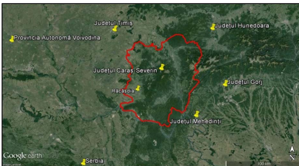
Fig. 1. Localizarea localității Răcășdia.