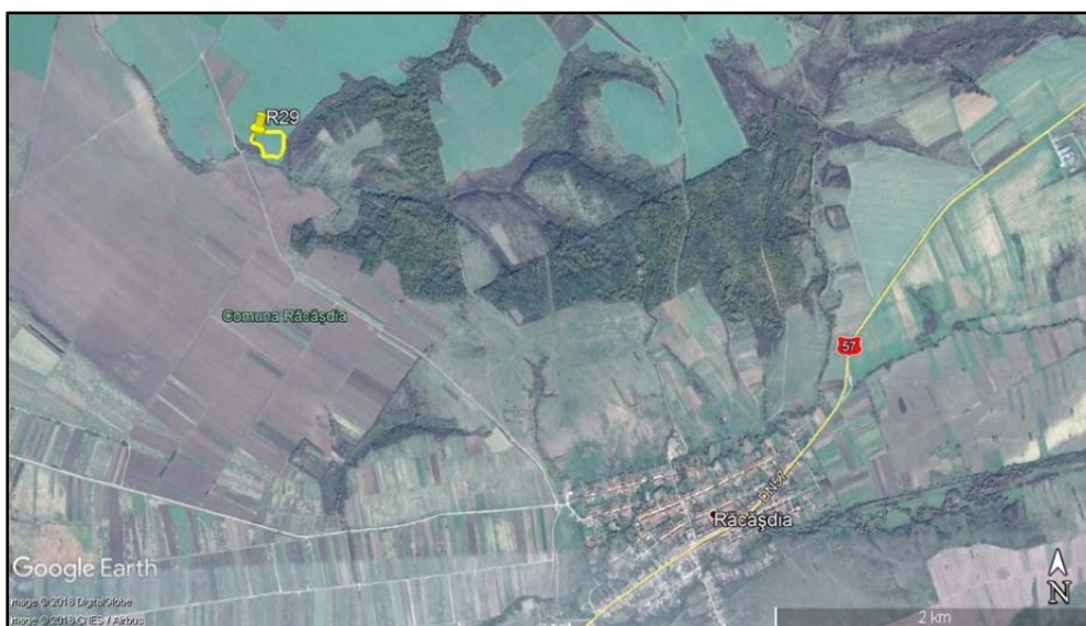
Fig. 6. Situri din Evul Mediu dezvoltat.

Descoperiri din această perioadă au fost realizate la Gornea 16 , Dudeștii Noi-46 17 , Giulvăz-6 18 , Giulvăz-8 19 , Crai Nou-3 20 , Săcălaz-5 21 , Utvin-1 22 .