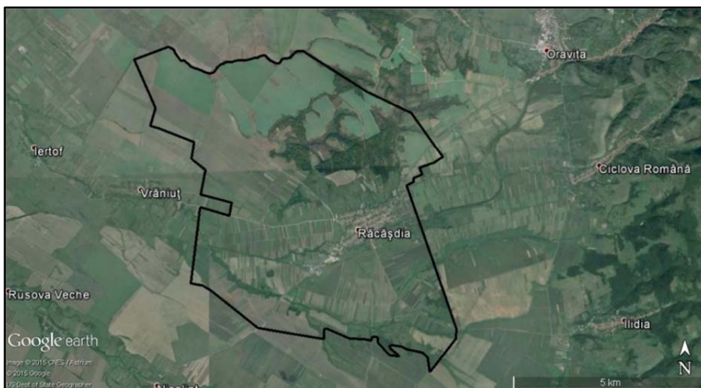
Fig. 2. Hotarul cadastral al Răcășdiei.