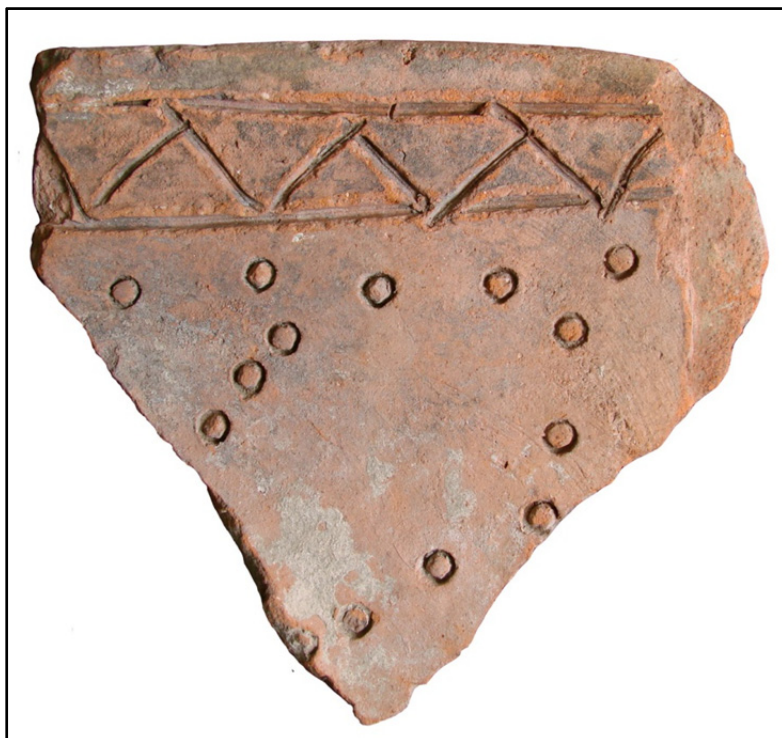
Fig. 4. Țiglă cu posibila reprezentare a jocului latina gaudes .