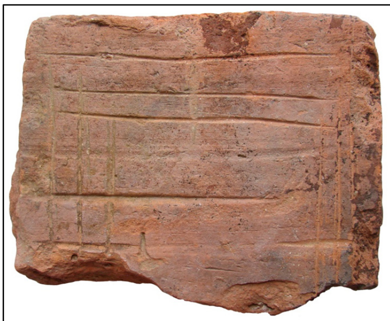
Fig. 3. Cărămidă cu reprezentarea jocului de moară.