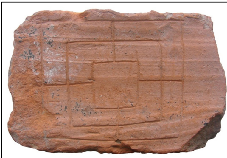
Fig. 2. Cărămidă cu reprezentarea jocului de moară 20 .

a apărut într-un groapă menajeră, alături de material divers. Pe fragmentul de cărămidă păstrat este vizibilă o parte a rețelei de linii care compun jocul de moară, redată în pasta crudă, neîngrijit, dovedind stângăcia sau nepăsarea celui care le-a realizat. Pe una dintre laturi, cele trei linii paralele au fost retrasate după ardere, probabil fiind prea puțin evidente. Sunt vizibile și alte urme, impresiuni sau linii, realizate tot în pasta crudă, fără legătură cu jocul.