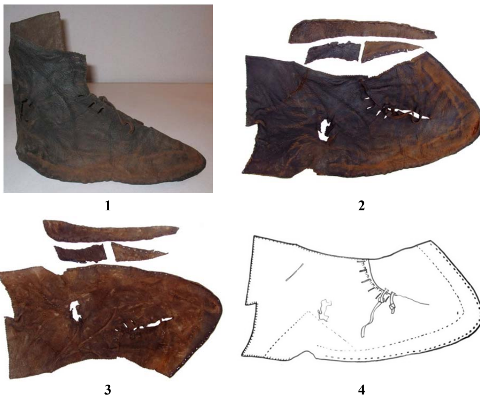
Fig. 1–3. Față de încălțăminte; 4. Relevu.

Este una dintre cele mai complete fețe de încălțăminte 4 . Gheata a fost realizată pentru piciorul drept și a fost croită asimetric dintr-o singură bucată de piele, care prin închidere formează gheata tridimensională cu o îmbinare de trei fragmente mici de piele, aflate spre maleola internă a gleznei 5 .