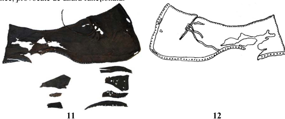
Fig. 11. Față de încălțăminte picior stâng; 12. Relevu.

Starea de conservare în prezent este foarte bună. După tratamentele aplicate se pot distinge mai clar zonele lacunare, dinspre exteriorul piciorului. În zona de vârf și al carâmbului se pot observa exfolieri, rupturi, urme ale suprasolicitării mecanice, provocate de uzura funcțională.