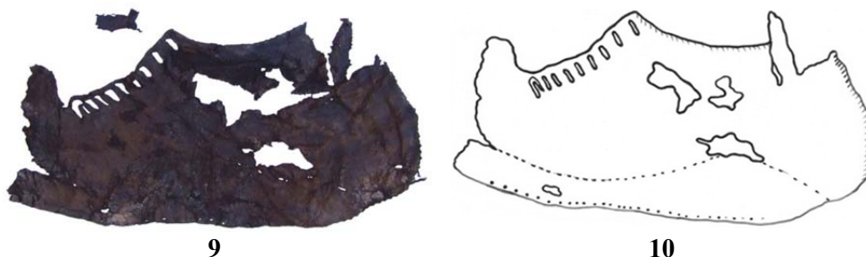
Fig. 9. Față de încălțăminte pentru piciorul drept; 10. Relevu.

Croită dint-o singură bucată, dimensiunile căputei sunt: 34,5; 20; 19; 10 cm. Vârful are o tendință ascuțită, crăpătura din față, aflată pe ristolul piciorului, este de 8 cm. Pentru închidere artefactul este prevăzut cu două șuvițe de piele cu o lungime de 4,5 și 15 cm.