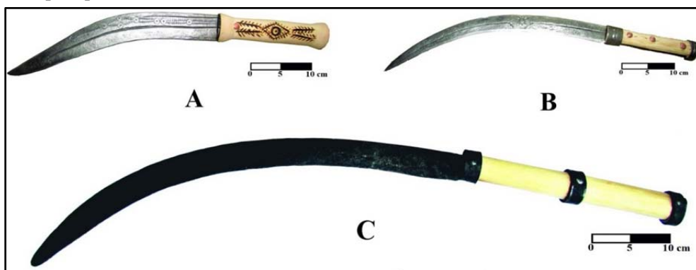
Fig. 3. Replici experimentale ale unor arme curbe dacice utilizate în spectacolele asociației de “reenactment” Terra Dacica Aeterna.

tul și dimensiunile, fără a avea interesul de a respecta neapărat materialele și tehnicile folosite în acea perioadă (acest lucru nu împiedică unele grupări de acest gen să utilizeze pe cât posibil echipamente confecționate după tehnici antice, faptul acesta apropiindu-le mai mult de etaloanele la care se raportează și crescând valoarea acțiunilor întreprinse). Primul grup de reconstituire istorică pe perioadă antică din România își definește activitatea în felul următor: “ TERRA DACICA AETERNA este prima asociație din România care se ocupă cu reenactment-ul legat de perioada antică. Reenactment-ul este o modalitate prin care istoria este “retrăită” la propriu, prin confecționarea de îmbrăcăminte, arme, unelte, locuințe, pe care pasionații de reenactment (reenactorii) le folosesc în cadrul unor momente mai mult sau mai puțin regizate. Confecționarea echipamentului se face în urma studierii izvoarelor istorice legate de perioada de timp care se dorește a fi “reînviată”, astfel încât totul să fie cât mai aproape de realitatea acelor vremuri ” 12 .