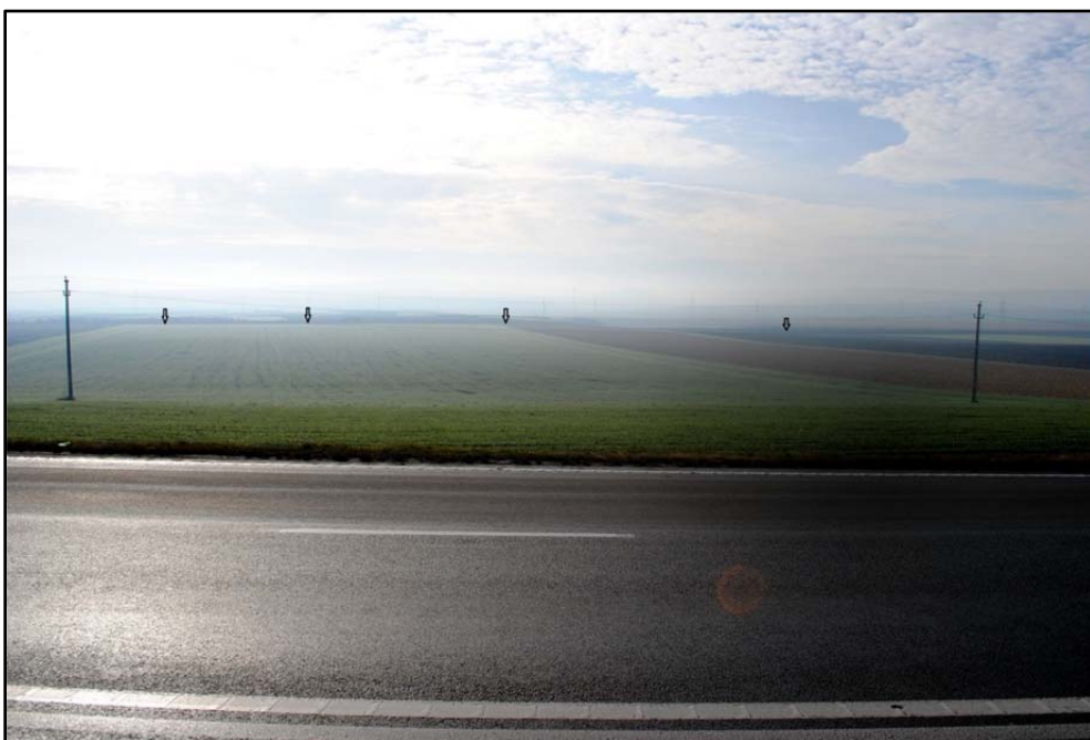
Fig. 2. Vedere panoramică cu traseul drumului roman marcat cu săgeți în planul secund al fotografiei, la sud-vest de localitatea Iernut (foto Florin-Gheorghe Fodorean, 10 decembrie 2014).

Semnul convențional cu care apare reprezentat drumul este o linie simplă sau întreruptă, corespunzătoare pe hartă simbolului de “ drum natural ” și “ drum de care ”. Interesant este că drumul acesta este marcat și spre vest, peste meandrul Mureșului de la Bogata, cu același semn convențional, până la Gheja, undeva la sud de localitatea Chețani. Urmele sale se observă și în prezent pe teren (Fig. 2).