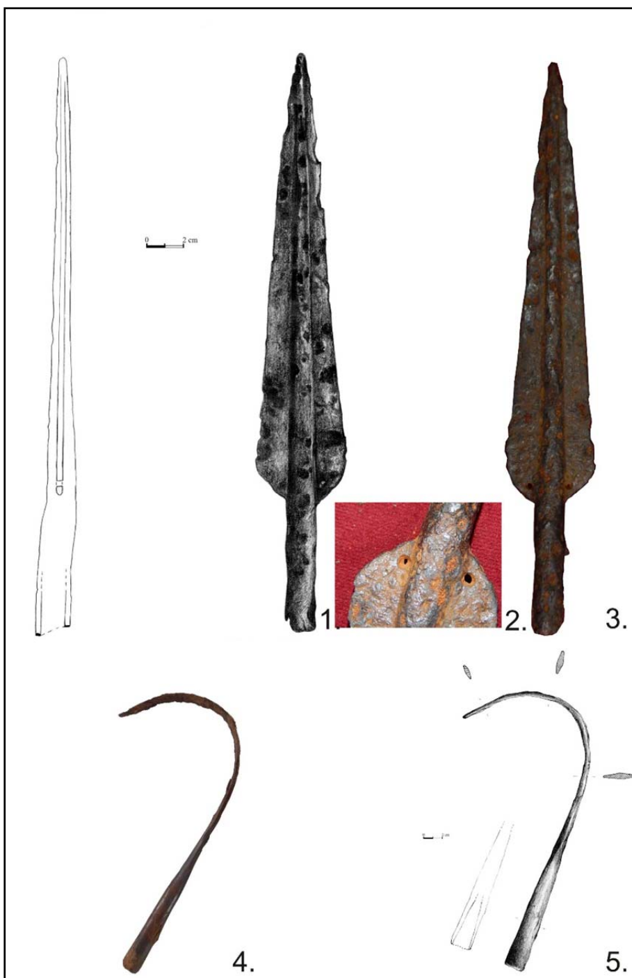
Fig. 2. Vârfuri de lance din fier (desene Otilia Bocănicu).