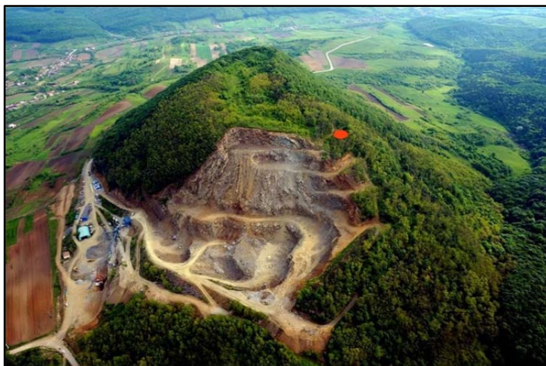
Fig. 1. Măgura Moigradului. Imagine generală dinspre sud. Punctul roșu reprezintă locul descoperirii capacelor din complexul 9/2010.

Deal de origine vulcanică, o masivă masă de piatră (andezite, granite etc.), care este exploatată în prezent de o carieră situată pe versantul de SV al dealului, Măgura Moigradului ne apare ca un impresionant trunchi de con cu altitudinea maximă de 514 m și o diferență de nivel 2 față de valea Ortelecului , care a creat trecătoarea amintită, de 224 m (Fig. 1). Platoul superior al conului vulcanic amintit, de formă ovală, are un diametru mare de cca. 400 m, iar cel mic de cca. 250 m, suprafața totală a acestuia fiind de 7 ha.