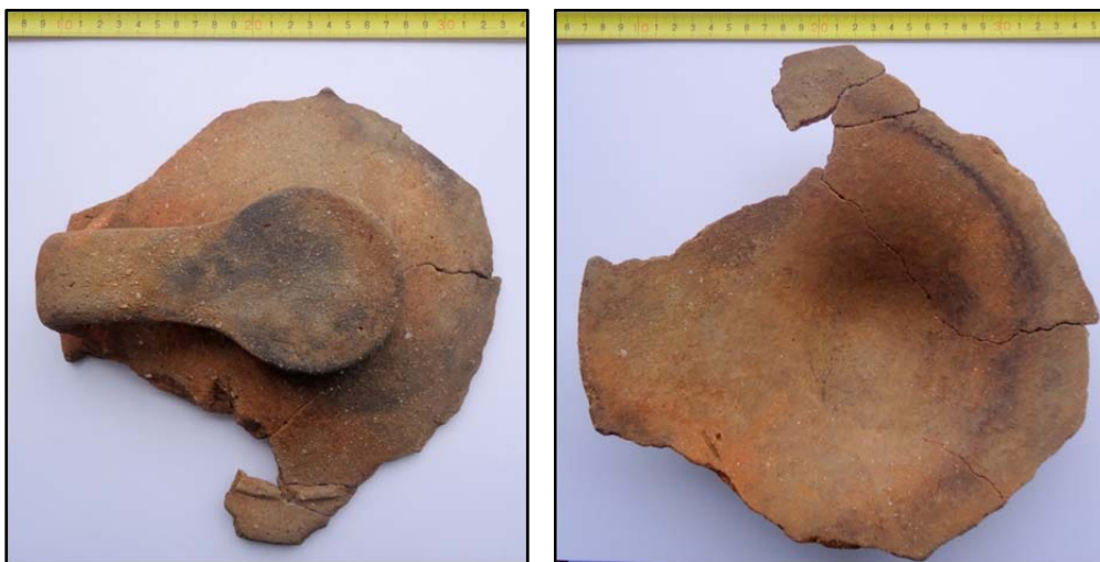
Fig. 5. Capacul nr. 1.

Capacul nr. 1 (Fig. 5, 7) are un diametru mare de 26 cm, iar cel mic al părții superioare de 8 cm. Înălțimea vasului este de 6 cm. Toarta, cu secțiune ovală, are diametrul mare de 4cm și unește buza de “fundul” vasului. Ornamentul capacului este un brâu continuu cu secțiune trapezoidală amplasat spre buza recipientului.