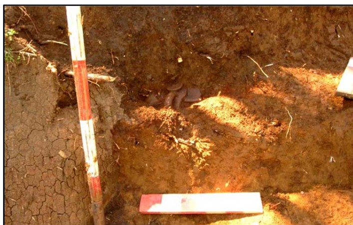
Fig. 3. Măgura Moigradului 2010, secțiune prin complexul C9.