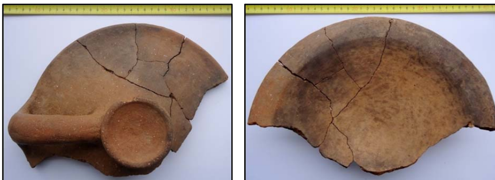
Fig. 6. Capacul nr. 2.

lui este de 6 cm. Toarta, cu secțiune ovală, are diametrele de 2,5 și 3 cm și unește buza de “inelul de fund”. “Ornamentul” capacului este un brâu continuu cu secțiune semi-sferică amplasat pe buza recipientului.