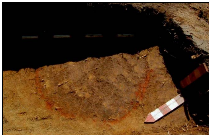
Fig. 2. Măgura Moigradului 2010, complexul C9 la conturare.