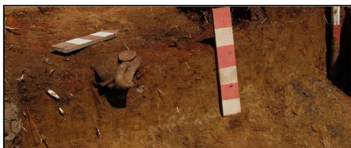
Fig. 4. Măgura Moigradului 2010, complexul C9 la finalul cercetării cu capacele in situ .