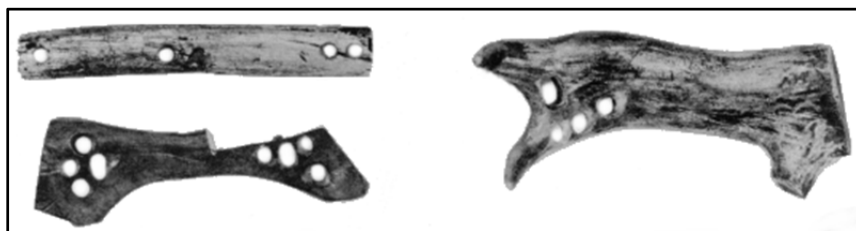
Fig. 4. Alte tipuri de netezitoare originare din Groenlanda 12 .

Astfel de piese, de altă formă (Fig. 4), însă cu aceeași întrebuințare, au fost semnalate nu doar în Europa și Asia, ci și în Groenlanda, confecționate din fildeș, os sau corn, cu orificii speciale pentru introducerea fâșiilor de piele 10 și chiar în Statele Unite ale Americii 11 .