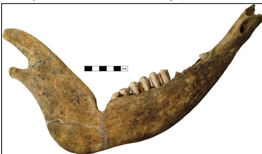
Fig. 2. Netezitorul pentru fâșii de piele descoperit la Săveni- La Movile .

Netezitorul pentru fâșii de piele descoperit la Săveni a fost amenajat pe jumătatea dreaptă a unei mandibule de Bos taurus (Fig. 2).