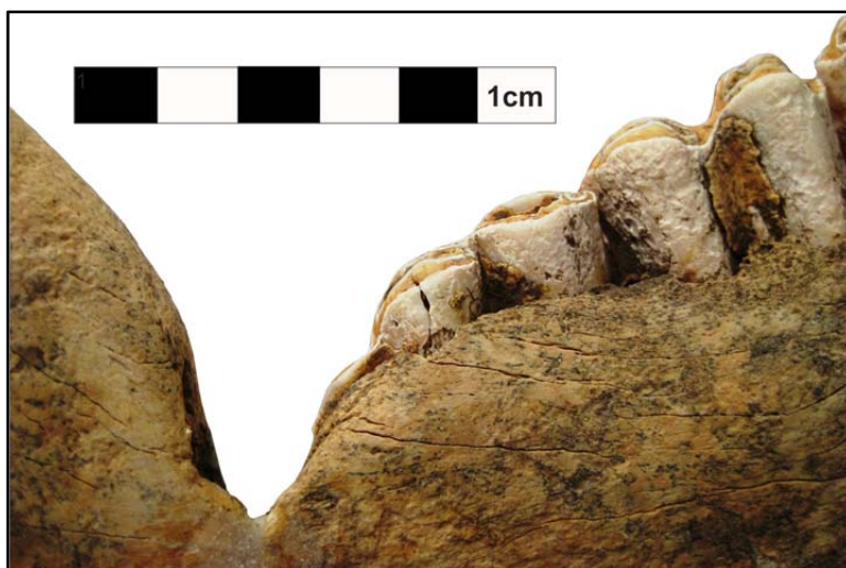
Fig. 3. Detaliu – partea activă a netezitorului.

Astfel, la nivelul debitajului nu putem afirma existența unei transformări tehnologice importante. Singurul detaliu vizibil constă în faptul că mandibula a fost spartă în zona arcadei incisive pentru a se obține suportul pe care a fost amenajată piesa. Exceptând o presupusă percuție, alte stigmat tehnologice nu au fost observate. Cea mai vizibilă transformare este cea funcțională, observată prin tocirea nenaturală a molarilor și a zonei învecinate molarului M3, care prezintă gradul cel mai mare de uzură. Această zonă a fost supusă, cel mai probabil unei intense frecări, fapt care a determinat formarea unei caneluri în forma literei U cu pereții ușor evazați (Fig. 3).