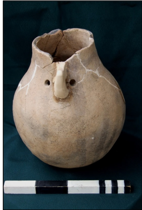
Fig. 5–6. Amfor în timpul restaurării (stânga) și după restaurare (dreapta).