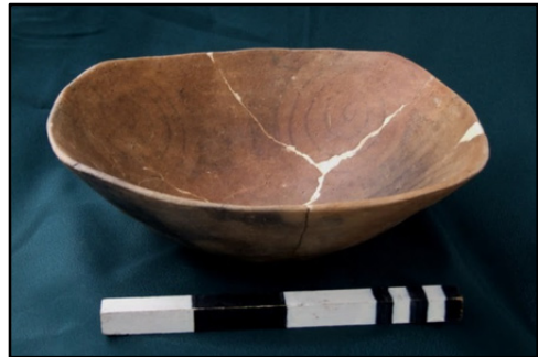
Fig. 7–8. Strachin după restaurare.

La finalul acestui demers, considerăm că modesta noastră contribuție va fi utilă și altor colegi care se vor confrunta pe viitor cu problematica restaurării și conservării ceramicii decorate cu mixturi bituminoase.