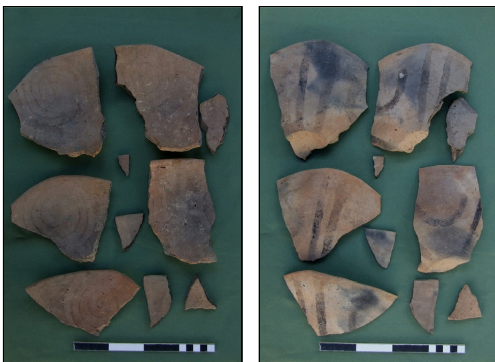
Fig. 3-4. Strachin întregibil , dup eviden ierea urmei (amprentei) decorului.