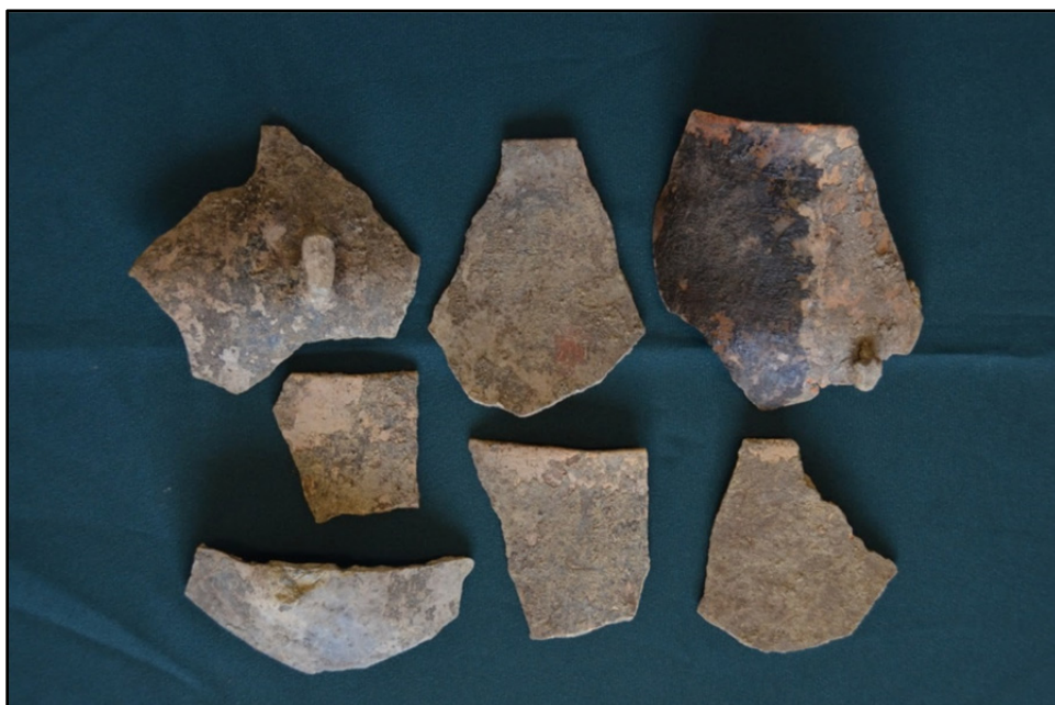
Fig. 2. Strat pictural compact (dreapta sus), eviden iat în timpul restaur rii.